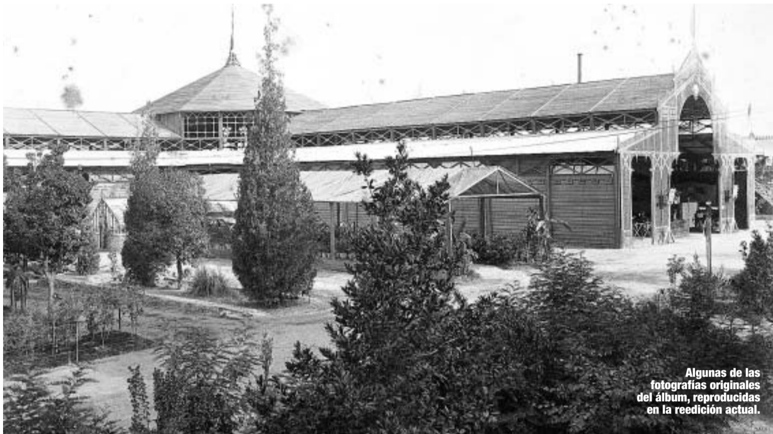
Algunas de las fotografías originales del álbum, reproducidas en la reedición actual.