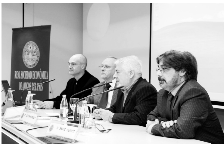
Un moment de la taula redona.