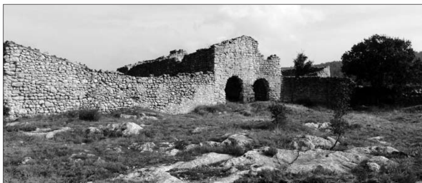
Restos del poblado morisco de La Atzuvietta (La Vall d'Alcalá).

Los lugares donde se asientan los nuevos pobladores tienen un planteamiento ya planificado de calles previamente trazadas y bien distribuidas, en la que cada parcela doméstica se ajusta a unos límites preestablecidos que impiden el crecimiento o desarrollo orgánico de la unidad familiar. Evidentemente todo, en el comienzo, cada unidad familiar surge de forma aislada; el crecimiento posterior tiende a generar unas formas orgánicas y unos encuentros entre las diferentes unidades domésticas que tienen una apariencia como la que vemos en esta imagen, que es en realidad un despoblado, pero no un despoblado valenciano, es un despoblado de la Argelia contemporánea, producido por el éxodo rural de las últimas épocas, aunque con un aspecto muy parecido al que podría tener una alquería del territorio valenciano, lo que conocemos como territorio valenciano. Llama la atención que es difícil distinguir donde acaba una unidad doméstica y donde comienza otra.